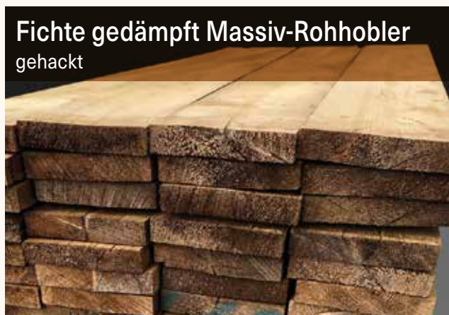
Fichte gedämpft Massiv-Rohhobler gehackt