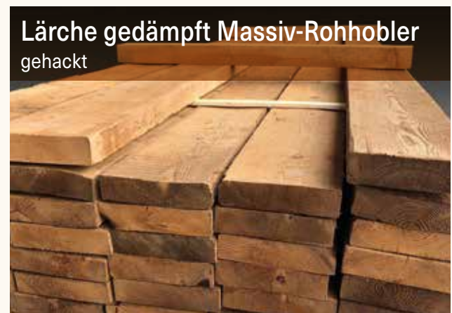
Lärche gedämpft Massiv-Rohhobler gehackt