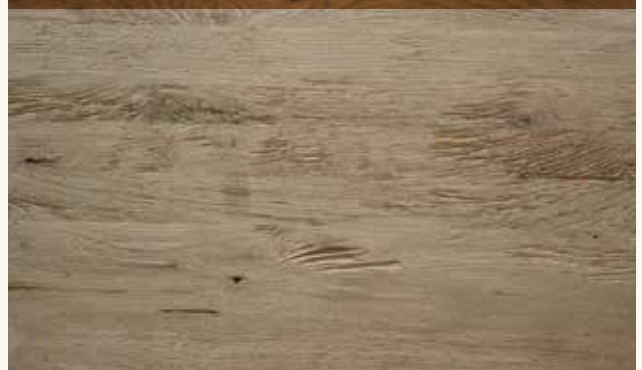
Eiche Rustikal 3-Schichtplatte gehackt und gebürstet

Länge in mm 2350 Breite in mm 2250/1220 Stärke in mm 19