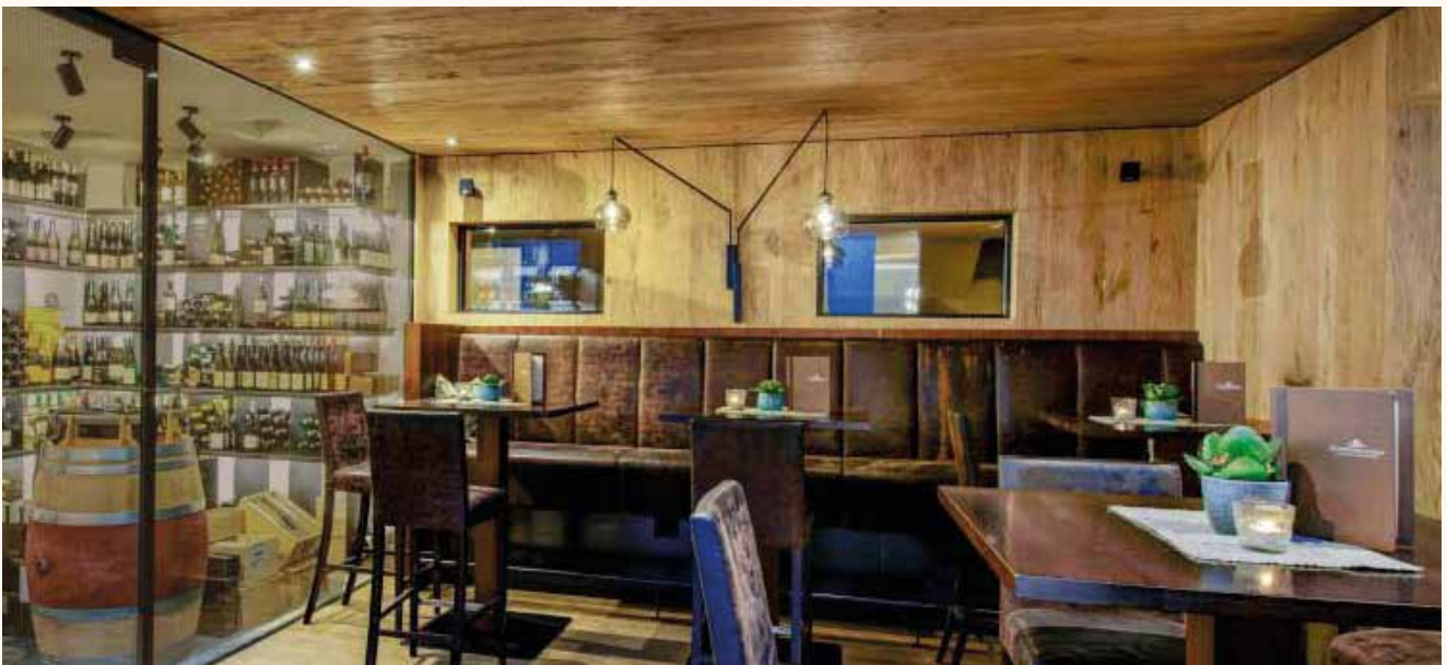
Fichte Altholz 3-Schichtplatte gehackt und gebürstet